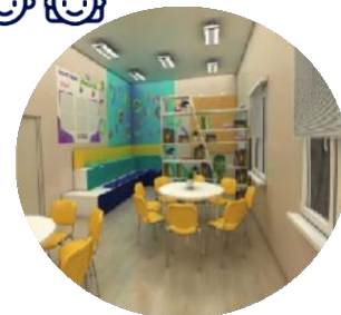
ЦЕНТРЫ ДЕТСКИХ ИНИЦИАТИВ