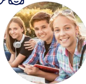
ДЕТСКИЕ ОБЩЕСТВЕННЫЕ ОБЪЕДИНЕНИЯ